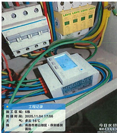
图 1 安装节能装置电表起始值： 0.0 度电