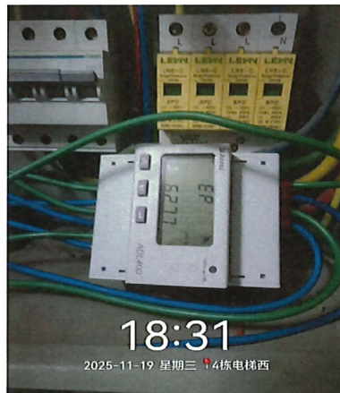
图 3 未使用电梯节能装置 8 天电表最终值： 627.7 度电