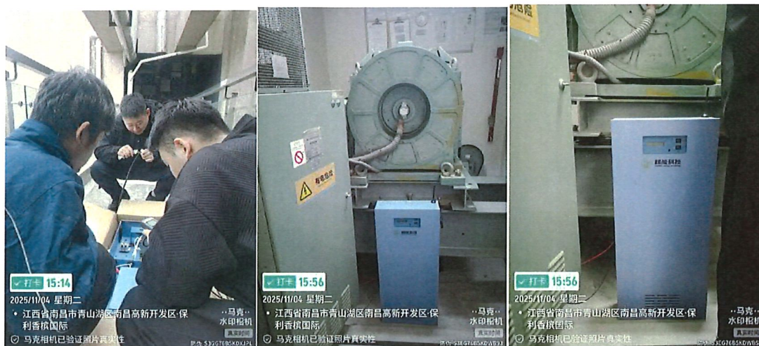
电梯已安装电梯节能装置