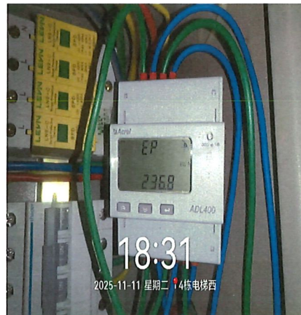
图 2 电梯节能装置 7 天电表最终值： 236.8 度电