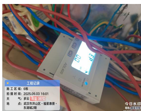
图1 安装节能装置电表起始值： 0 度电