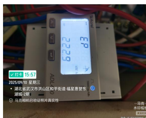
图2 电梯节能装置7天电表最终值： 222.9 度电