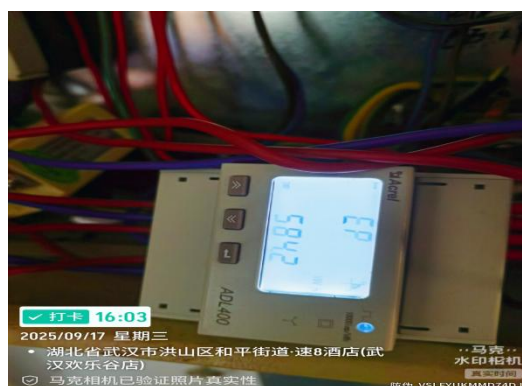
图3 未使用电梯节能装置电表最终值： 584.2 度电