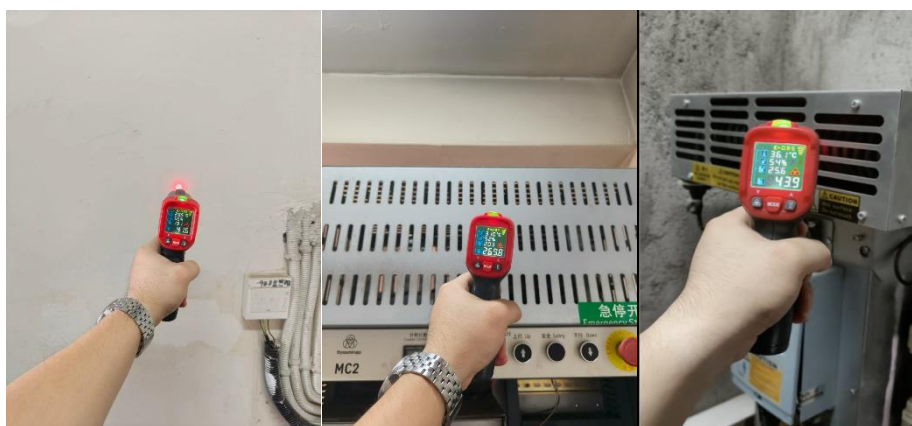
现场环境温 41.6℃ 未安装电梯节能装置电阻温 269.8℃ 已安装电梯节能装置电阻温度 43.9℃

由以上图片可看出，安装了电梯节能装置后电阻温度已完全不发热接近室温，充分体现电梯再生能源完全回收，减少机房最主要的热源，降低了机房空调的用电量，从而达到节能目的。