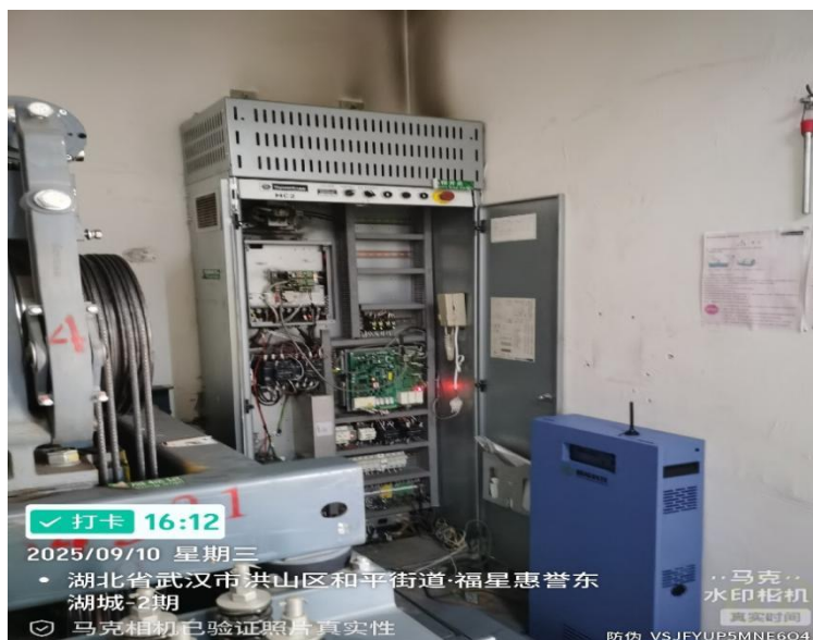
电梯已安装电梯节能装置