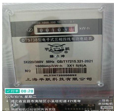
图 1 安装节能装置电表起始值： 103.15 度电