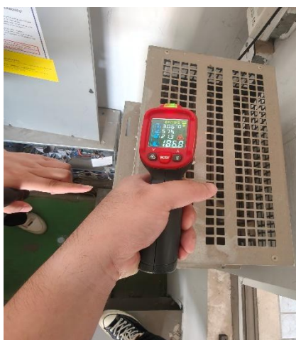
未安装节能装置, 电阻温度(186.8°C)