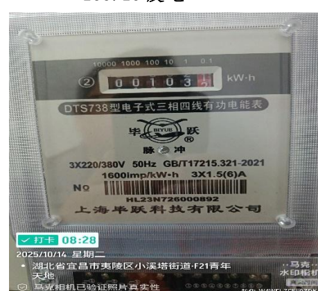
图 4 未使用电梯节能装置电表值： 103.15 度电