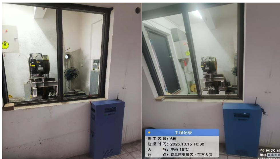
电梯已安装电梯节能装置