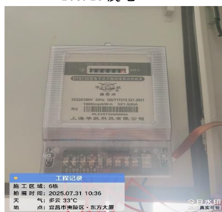
图 3 未使用电梯节能装置电表起始值： 0.4 度电