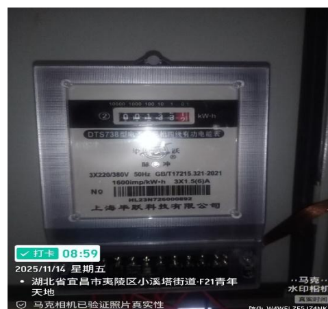
图 2 电梯节能装置 31 天电表值： 133.15 度电