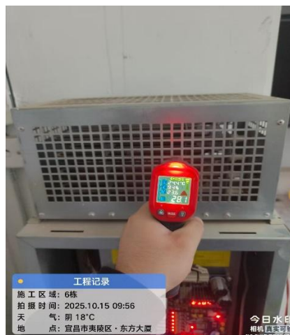
安装节能装置, 电阻温度(28.1°C)

由以上图片可看出，安装了电梯节能装置后电阻温度已完全不发热接近室温，充分体现电梯再生能源完全回收，减少机房最主要的热源，降低了机房空调的用电量，从而达到节能目的。